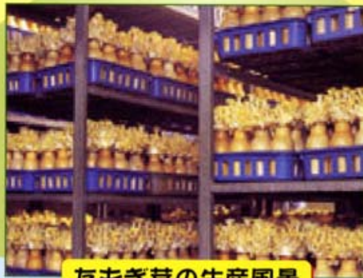
たもぎ茸の生産風景