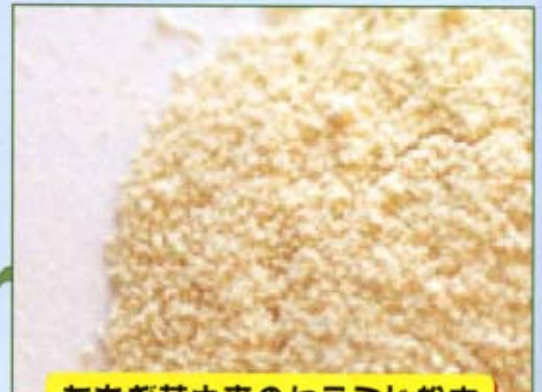
たもぎ茸由来のセラミド粉末